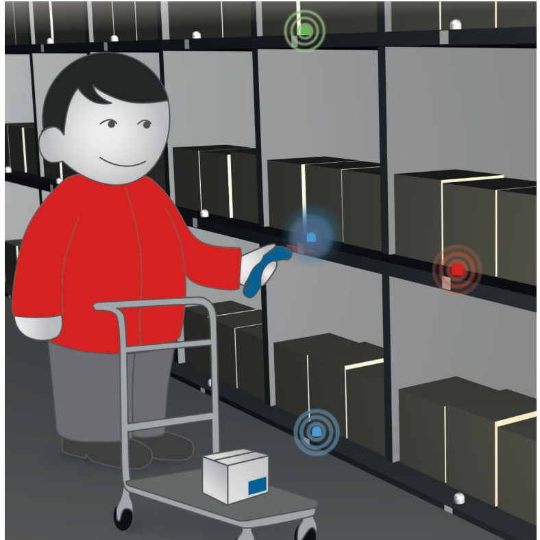
Beleglose Kommissionierung mit SCAN-2-LIGHT: Die Signalleuchten an den Lagerplätzen zeigen an, wo der nächste Artikel zu entnehmen ist.

Die iX-tech GmbH aus Saarbrücken hat im Zuge der Betreuung eines der erfolgreichsten saarländischen Versandhändlers das innovative SCAN-2-LIGHT System entwickelt. Ziel bei der Entwicklung war es ein Produkt anzubieten, bei dem die Kosten für jeden Lagerplatz möglichst gering ausfallen. Das Ergebnis ist ein innovatives System, dass zu einem Bruchteil des aktuellen Marktpreises angeboten wird – und dies bei höherer Funktionalität und Zuverlässigkeit. iX-tech bietet SCAN-2-LIGHT als Put-to-Light-System an der Boxrange und als Pick-by-Light und Put-to-Light-System für das gesamte Lager an.